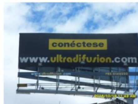
SENTIDO SUR - NORTE DE LA VALLA TUBULAR