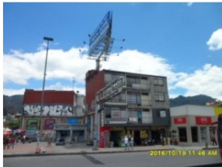
FACHADA DEL PREDIO