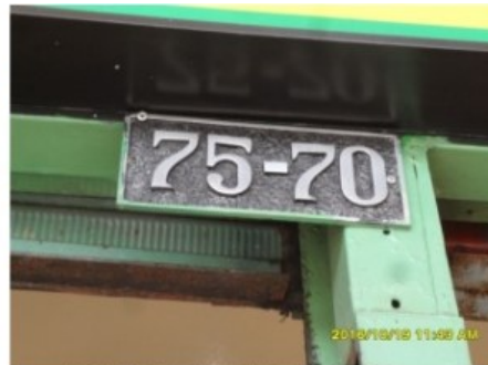
NOMENCLATURA DEL PREDIO